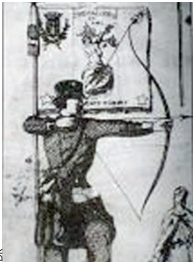
Le tir à l'oiseau

Autrefois, l'hiver était bien long, aussi nos ancêtres s'ennuyaient. Ils avaient aménagé des pauses dominicales et à la mi-carême. D'ailleurs, le mot « sport » provient du vieux français « se desporter », soit s'amuser.