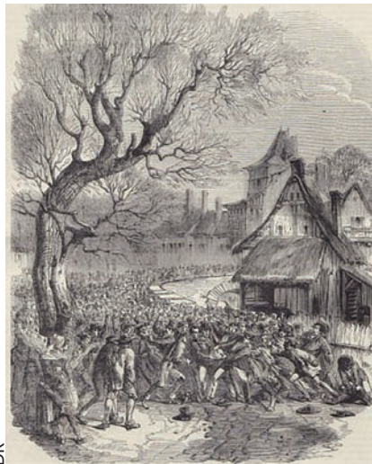
DR La soule